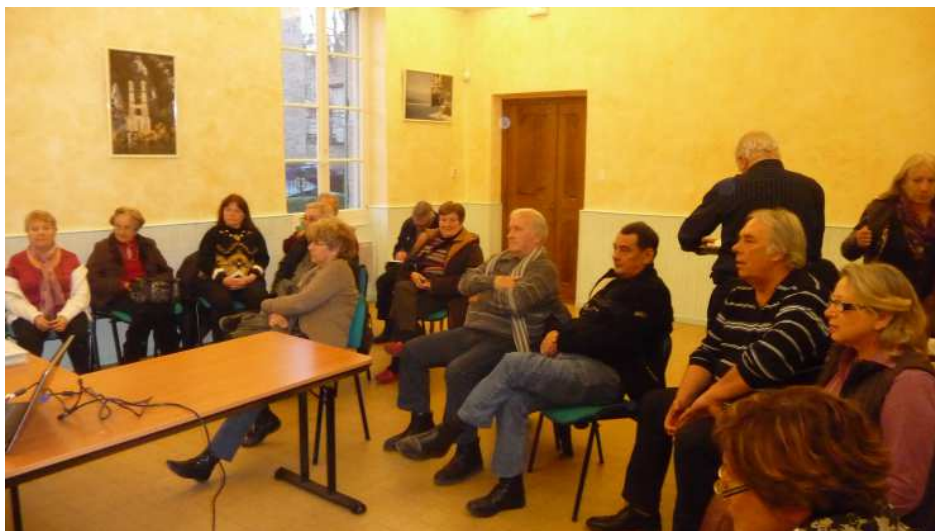
Assemblée générale de Mirabeau animation

Après une année 2012 menée tambour battant, avec pas moins de 14 manifestations festives, musicales, de solidarité (téléthon), et la fête votive, qui ont rassemblé des centaines de personnes, l'association poursuit sur le même rythme en 2013. Son assemblée générale du 26 mars (notre photo) a validé un programme de festivités varié et copieux avec en point d'orgue la fête votive du 2 au 6 août. Pour apprécier et mémoriser « le menu », consultez son site internet http://mirabeau-animation.com ou celui de la mairie http://www.mirabeauenluberon.fr .