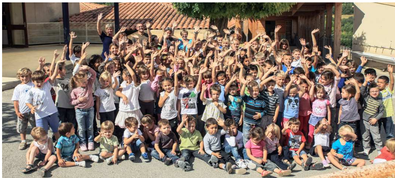
124 enfant scolarisés à la rentrée 2012

Faire des choix, c'est très souvent être visionnaire ! C'est prévoir que Mirabeau est voué à accueillir de nouveaux arrivants et permettre dès lors un développement harmonieux du village tout en s'inscrivant dans un projet de préservation du territoire et de respect du bien-vivre de ses habitants.